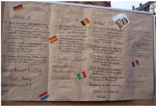
Plakate zum Thema