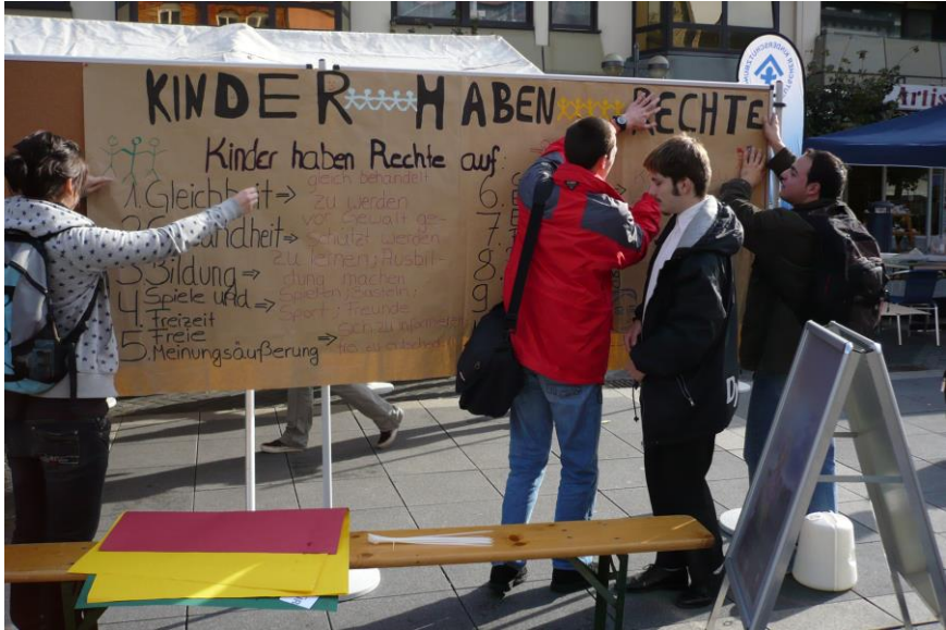
Aufbau der Ausstellung zum Thema Kinderrechte