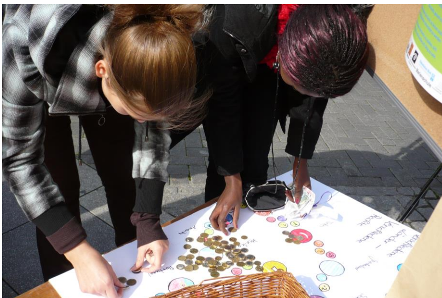
Die HBF FS06 spendete 138 Euro an den Kinderschutzbund

Alles in allem war es ein gelungener Tag und ein lohnender Beitrag zu einem wichtigen Thema.