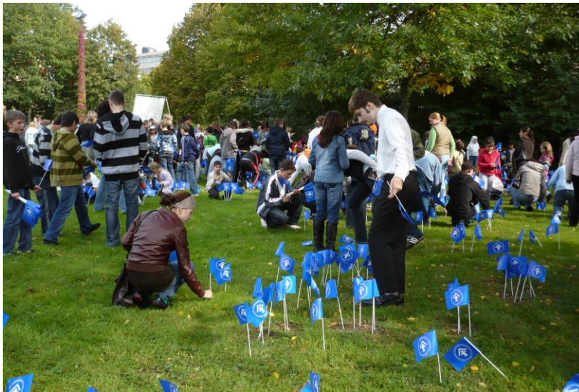
„Fähnchenstecken“ auf dem Berliner Platz