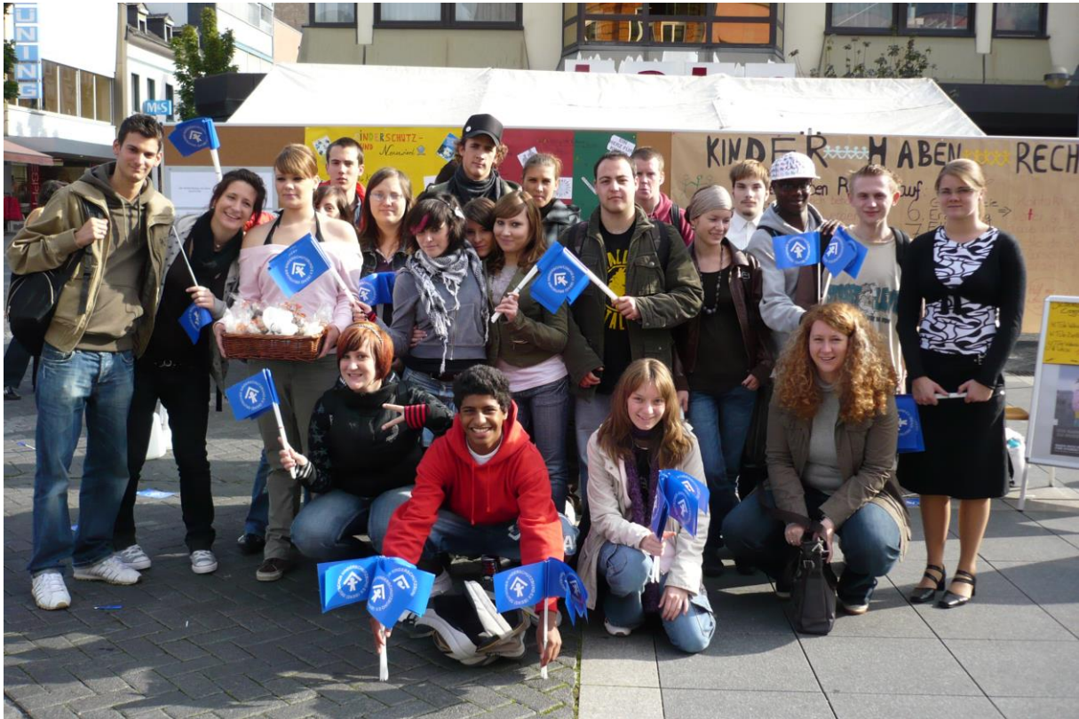
Schülerinnen und Schüler der HBF FS06