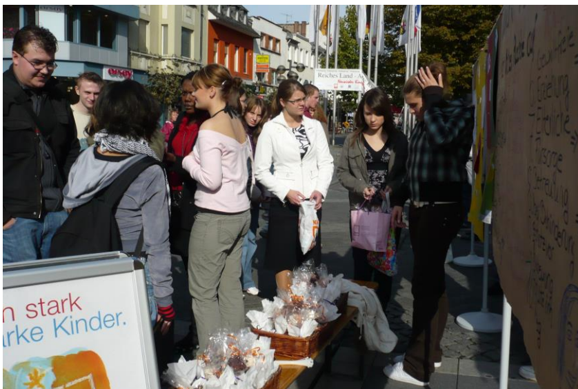
Plätzchenverkauf zugunsten des Kinderschutzbundes